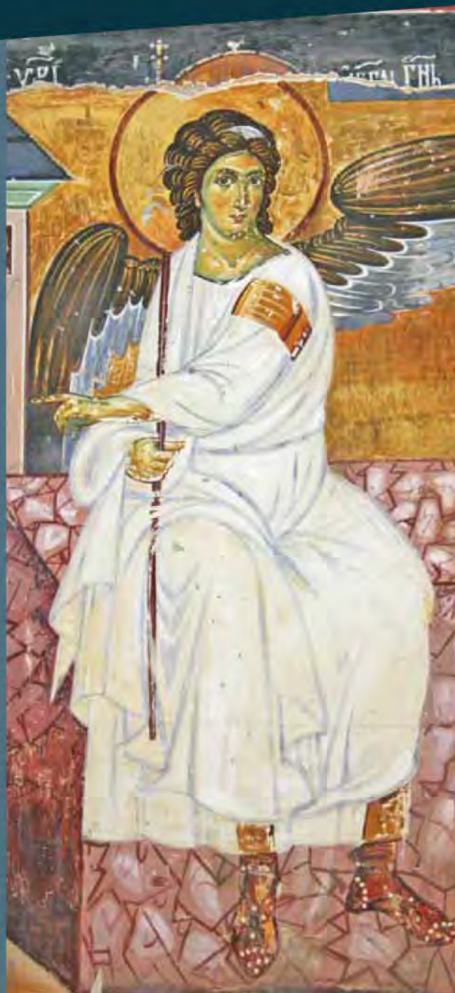
Самая знаменитая сербская фреска «Белый ангел» из монастыря Милешева была отправлена по первой спутниковой видеосвязи в 1963 году в качестве приветствия из Европы в Америку. Чуть позже этот сигнал был отправлен в космос.

В Сербии существует свыше двухсот монастырей, 54 из которых признаны памятниками культуры, а в список всемирного наследия ЮНЕСКО включены Стари-Рас с Сопочани, Студеница, а также средневековые сербские монастыри в Косово и Метохии – Дечани, Грачаница, Печский патриархат, Богородица Левшица.